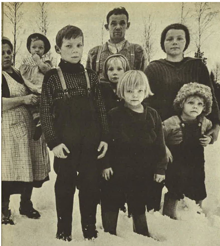
Kuva 1. Maalaisperheen isä. ”Isämme tästä maailmasta” -jutun kuvitusta.

Jutun näkökulma oli vastakkainen Paloheimon ajatuksille, sillä sen mukaan miesten rooli oli selkeästi alkanut muuttua perheenelättäjän roolista perheenisän roolin suuntaan. 60 Angelin mielestä miehiin kohdistui entistä ristiriitaisempia vaatimuksia, kun yhtäältä heidän piti omistautua enemmän perheelleen, mutta toisaalta heidän arvostuksensa perustui menestykseen työelämässä. Miehet olivat jo alkaneet ottaa aktiivisempaa roolia isänä, mutta heihin suhtauduttiin epäillen: jos mies vei lapsensa kasvatukseen, ”hän tietää miltä tuntuu seistä siellä kaikkien naisten silmätikkuna”. Lisääntyneen vapaa-ajan ansiosta miehillä olisi ollut enemmän aikaa perheelleen, mutta