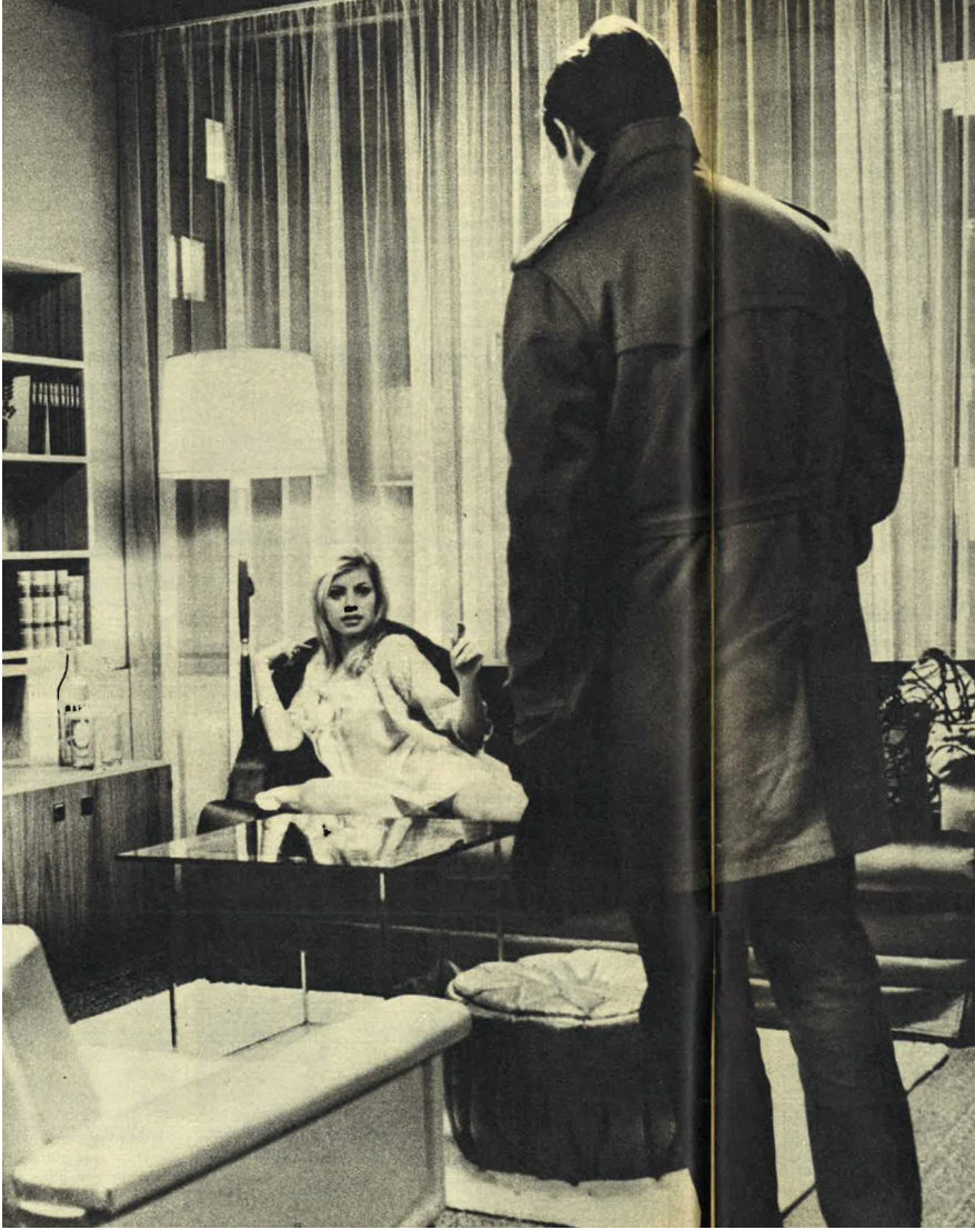
Kuva 5. Kun mies menee rakastajattaren luo, vastassa ei ole väsynyt ja kuluneisiin vaatteisiin pukeutunut keski-ikäinen nainen, vaan seksikkäästi pukeutuva, miehestä kiinnostunut nuori nainen.

etäännyttäneet hänet muusta perheestä. Hän oli hankkinut rakastajattaren stressaavaa elämäntilannetta helpottamaan, mutta vaimo oli ottanut tämän vuoksi eron. Terveysongelmien vuoksi mies oli irtisanottu töistä. Kaikken-