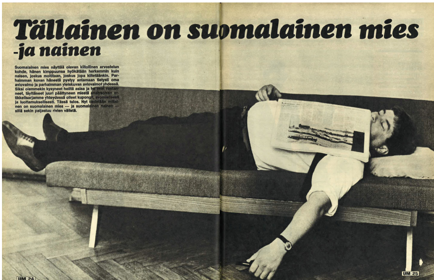
Kuva 2. ”Tällainen on suomalainen mies” -jutun pääkuva.

Toisessa käänösartikkelisarjassa kerrottiin miehen elämästä saksalaisten tilastojen pohjalta ja pyydettiin lukijoita kommentoimaan, millaista suomalaisten miesten elämä oli. Lukijoiden vastauksiin pohjaava juttu ”Tällainen on suomalainen mies – ja nainen” kertoi aviopuolisoiden roolien olevan melko tasa-arvoisia. Noin 80 prosenttia aviomiehistä oli vaimolleen uskollisia ja helliä. Vain kolmasosa vaimoista koki, että puoliso piti heitä talouskoneena. Noin 60 prosenttia miehistä auttoi vaimoan kotitöissä ja 80 prosenttia osallistui lasten kasvattamiseen. Miehen asema perheenpäänä oli kuitenkin vahva: mies päätti perheen asioista 86 prosentissa perheistä. 83 Juttukokonaisuuden visuaalinen sisältö kertoi kuitenkin toisenlaista tarinaa. Jutun pääkuvassa mies makasi sohvalla sanomalehti peitteenään ja toisen aukeaman yläosaan oli leipätekstistä poimittu nosto: ”Hän olisi voinut pitää samoja alusvaatteita vaikka kuinka kauan, mutta muutti kerran viikossa kun olin vielä käskemässä.”