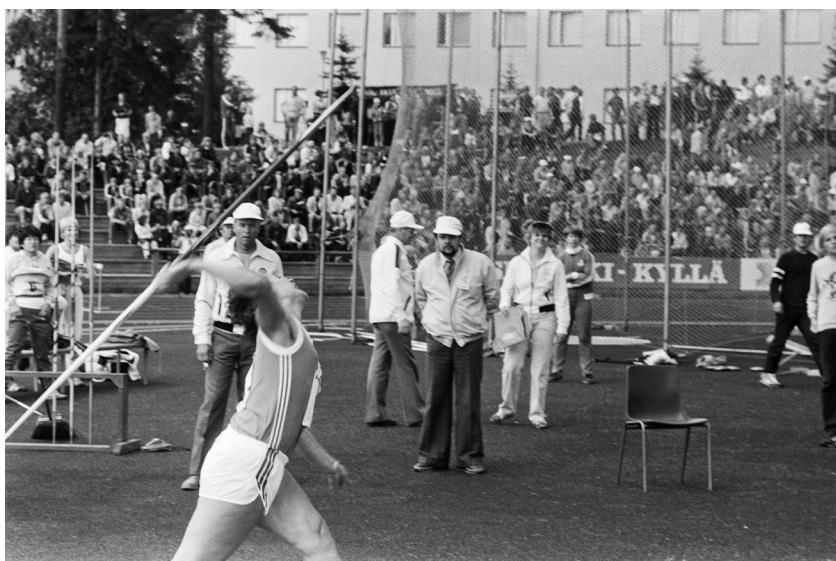
Kuva 2. Tiina Lillak kilpailee voitokkaasti Kouvolassa 16.7.1981. Katsomot täyttivät ympäri Suomea, kun Lillak oli mukana tuloksekkaina vuosinaan. Nyt urheilijan suorituksessa sallittiin myös voima ja äärimmäiset liikeradat. 79

Artikkelissa analysoitiin naisten miehistä poikkeavaa kohtelua urheilumedioissa. Yhtenä syynä esitettiin urheilutoimittamisen perinne: ”miesten tekemää – miehille – miehistä.” Tällainen journalismi voi tuottaa seksualisointia, trivialisointia ja naisen asettamista eri asemaan mieheen nähden. Tämä todellisuus jatkui vuosikymmeniä länsimaiden urheilumedioissa. 78 Ilmiöstä kertoo sekin, että suomalaisen Liikuntatieteellisen seuran julkaisuissa ( Stadion -lehti ja Liikunta & Tiede ) olympiavuosina 1964–1984 oli vain kolme naisten urheilua käsittelevää artikkelia. Urheiluun keskittyvä tiede vierasti aihetta. Muutoksen merkit näkyivät vasta vuonna 1988, kun artikkeleita oli yhden vuoden julkaisuissa yhtä monta, kolme kappaletta. Tasa-arvolaki oli