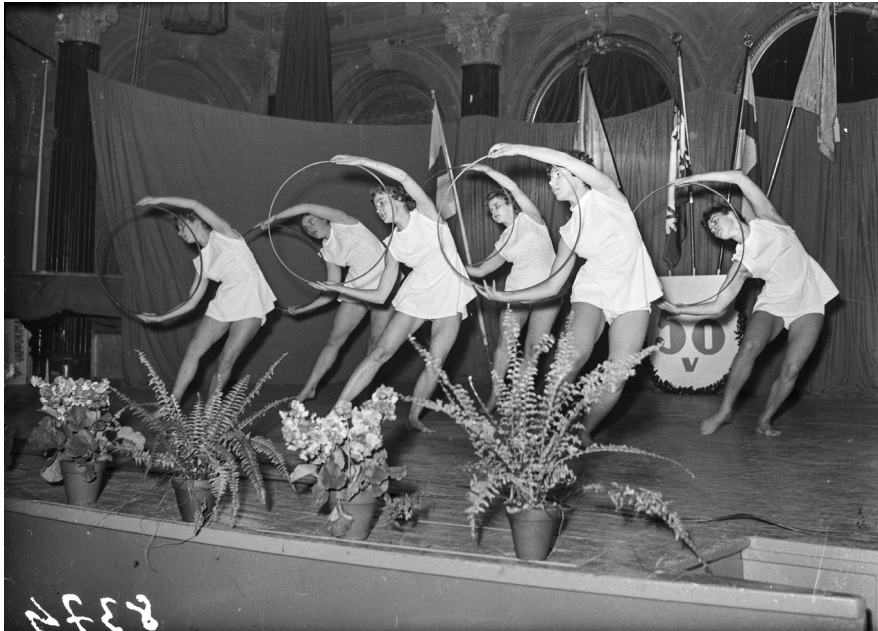
Kuva 1. Naisvoimistelijoiden ryhmä esiintyy SVUL:n Oulun piirin 50-vuotisjuhlassa 14.10.1956. Esityksessä korostuu naisilta vaadittu liikkeen plastillisuus ja kauneus. 43

Kilpaileminen ei tietenkään ollut kaikkien mieleen, koska niin sanottu "puhdas" naisvoimistelu haluttiin pitää erillään uusista rytmisistä ja tanssillisemmista suuntauksista. 44 Naisvoimistelu sai runsaasti huomiota niin vuoden 1972 kuin 1976 olympiakisoissa. Vuonna 1972 Neuvostoliiton 16-vuotias Olga Korbut nousi olympiavoittajaksi. Vuonna 1976 romanialainen lapsitähti, vain 14-vuotias Nadia Comaneci, kohosi vuorostaan parrasvaloihin. Hänestä kirjoitettiin paljon ja taitavan yksilön voittojen ylivoimaisuutta korostettiin. Mahdollisia rajun harjoittelun haittoja nuorelle ei juuri kommentoitu. Molemmat nuoret urheilijat esiintyivät hyvin usein urheilukuvissa Suomessa.