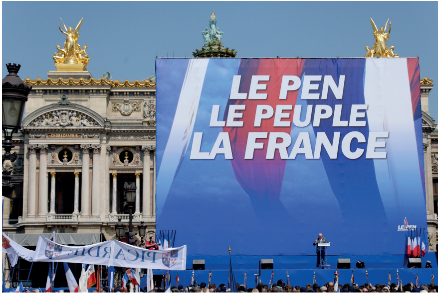
Kuva 1. Jean-Marie Le Pen puhuu Kansallisen rintaman vuotuisessa kokoontumisessa Jeanne d'Arcin patsaalla Pariisin keskustassa vuonna 2007.