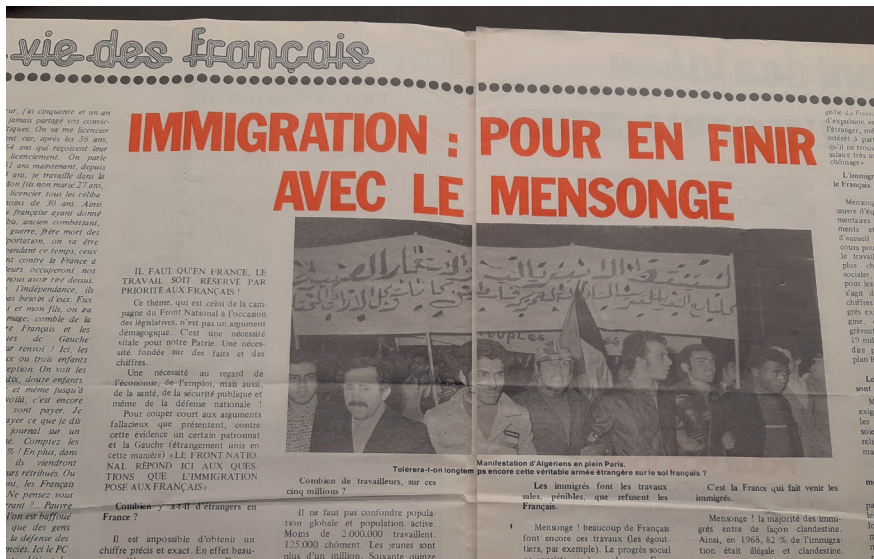
Kuva 3. ”Kuinka kauan siedämme tätä todellista ulkomaista armeijaa Ranskan maaperällä?” kysyi puolueen lehti Le National vuonna 1978.

1970-luvun retoriikassa. Vuoden 1974 presidentinvaalien aikaan puolueen lehti Front national julkisti erikoisnumerossaan: