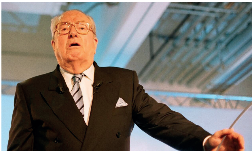
Kuva 5: Jean-Marie Le Pen oli vielä vallan kahvassa puolueessaan vuonna 2005.

identiteetin kanssa. 107 Algeriassa muslimit olivat suistaneet Ranskan imperiumin jalustaltaan, ja ”nyt uhattuna oli koko Ranskan olemassaolo”, kuten vuoden 1985 poliittinen ohjelma maalasi. 108