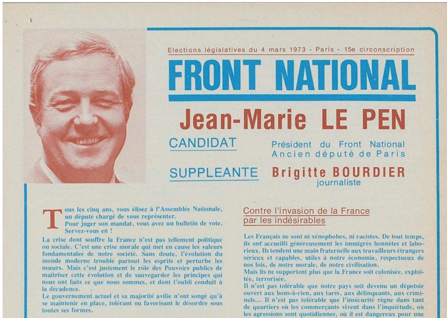
Kuva 2. Maahanmuuton vastainen teema oli etusivulla jo vuoden 1973 kansalliskokouksen vaaliesitteissä. Le Pen joutui kuitenkin kamppailemaan vielä pitkään poliitisesta marginaalista käsin.

talouttamme ja kunnioittavat lakejamme, moraaliamme ja sivilisaatiotamme. He eivät kuitenkaan siedä kotimaansa kolonisointia, hyväksikäyttöä ja terrorisointia. On sietämätöntä, että maastamme on tullut kaatopaikka hyödyttömille, jälkeensä jääneille, pahantekijöille ja rikollisille.