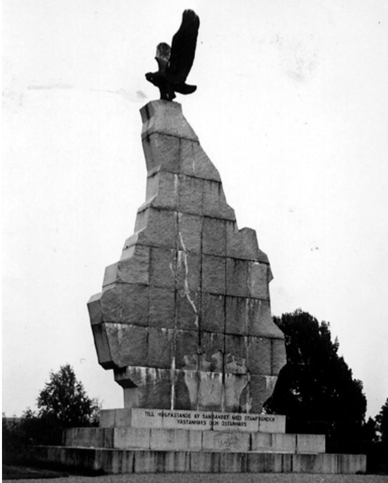
Stamfrändemonumentet vuonna 1964.