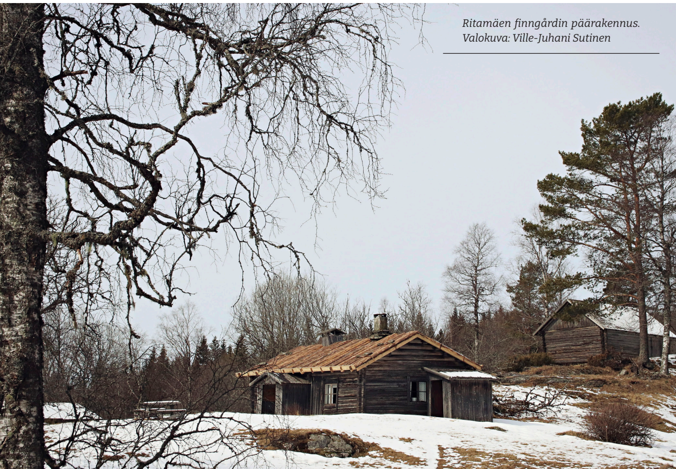
Ritamäen finngårdin päärakennus.

Päärakennus tuntuu suurelta. Ritamäki ei ollut varhaisimpia metsäsuomalaisten asujaimia, vaan isoksi kasvanut ja suhteessa vauras tila. Alun perin 1600-luvulla täällä, parisataa metriä nykyisestä päärakennuksesta pohjoiseen, sijaitti pieni mökki. Se raivasi vähitellen enemmän maata, ja 1800-luvun puolivälissä nousi isompi torppa. Uusikin talo oli savutupa, jotka olivat tavallisia niin itäsuomalaisten kuin metsäsuomalaistenkin parissa 1800-luvun loppuun asti. Lisäksi maille pystytettiin navetta, lato, mylly ja sauna.