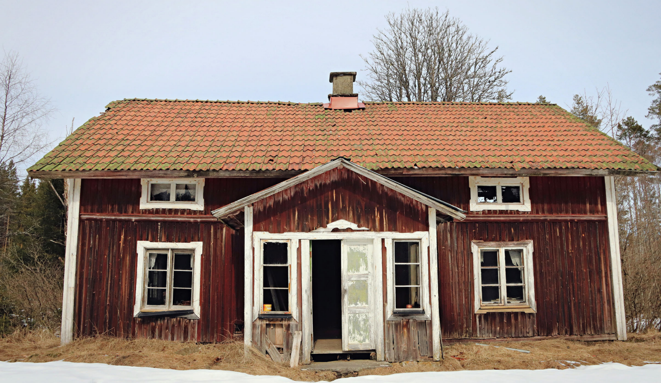
Autio Kissalamp.

Kissalampin perustivat 1780-luvulla kaksi Norjan kautta tullutta veljestä (Norjan rajalle on talolta alle kilometri). Seuraavalla vuosisadalla se oli metsäsuomalaisittain suuri ja menestyvä tila. Erityisen kiinnostavia ovat uuden päärakennuksen vaiheet toisen maailmansodan aikana: rajan läheisyyden vuoksi Saksan valtaamasta Norjasta lähteneet pakolaiset käyttivät sitä py-sähdyspaikkana tullessaan Ruotsin puolelle.