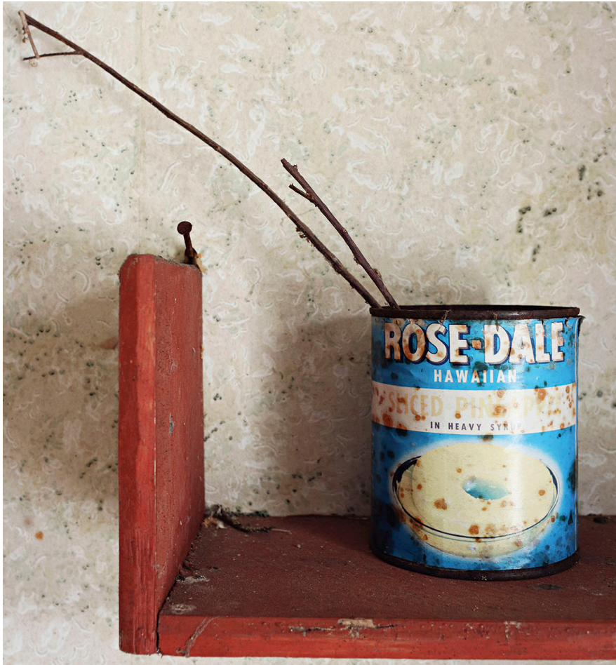
Hawaiian Pineapples.